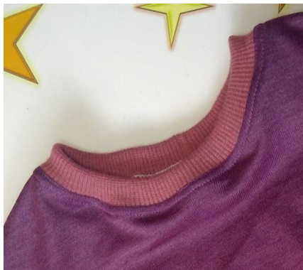
1. Runder Ausschnitt